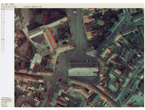
Softcopy met superimpositie

De Strabo fotogrammetriesoftware omvat alle taken in verband met fotogrammetrische kaartproductie. Met behulp van gebruiksvriendelijke beheerstools beheert en optimaliseert Strabo verschillende digitale beeldformaten en zet elk project om in een flexibele mappingomgeving. Stereo Viewing en Softcopy tools zijn GIS-geïntegreerd en geven toegang tot een compleet gamma bewerkingstools. De dataverwerkingstools omvatten onder meer gebundelde blokvereffening, automatische tie-point matching, dynamische navigatie in stereomodellen, orthorectificatie, montage van mozaïeken en stitching, DEM-creatie en 3D-weergave.